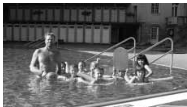
Viel Spaß haben die Kinder beim Schwimmkurs.

geleitet. Mit der Durchführung dieses Kurses sollen Badeunfälle mit Nichtschwimmern in Zukunft verhindert werden.