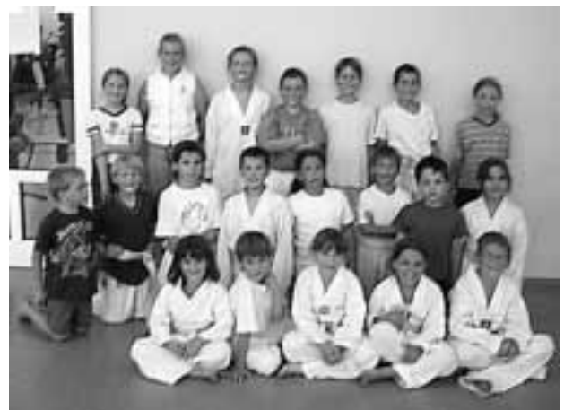
Das 3-jährige Jubiläum feierte die Selbstverteidigungsgruppe im Club Top & Fit.

E-Mail: s-d-i@aon.at, Internet: www.s-d-i.at