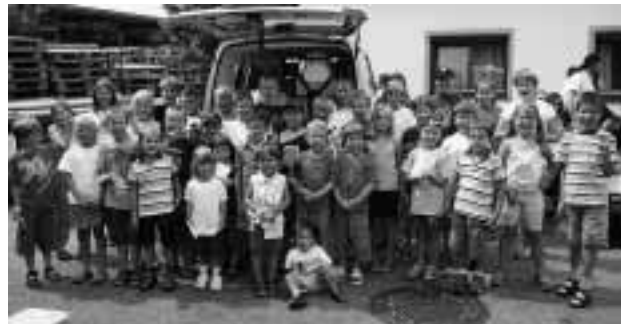
Das war spannend! Beim Jugendrotkreuz gabs allerhand zu erleben.

Rettungsautos einmal ganz von nah beschnuppert, einen Verband angelegt und jede Menge Spaß gehabt! Beim Jugendrotkreuz in Bad Vöslau!