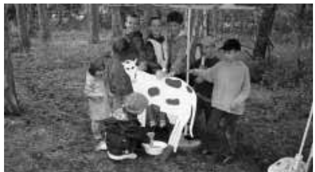
Sogar eine fast echte Kuh musste gemolken werden.

Trotz des unfreundlichen Wetters kamen viele Kinder auf die Vöslauerhütte und hatten eine Riesengaudi bei den Spielen der Naturfreunde.