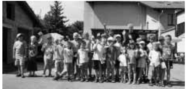
Interessantes und lustiges gabs bei der Feuerwehrjugend.

Am 24. Juli kamen zahlreiche Kinder zur Feuerwehrjugend Bad Vöslau und hatten jede Menge Spaß.