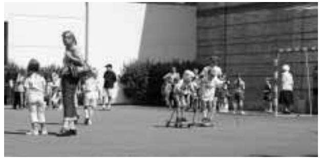
Richtig austoben konnten sich die Kinder beim Ferienspiel des ÖTB